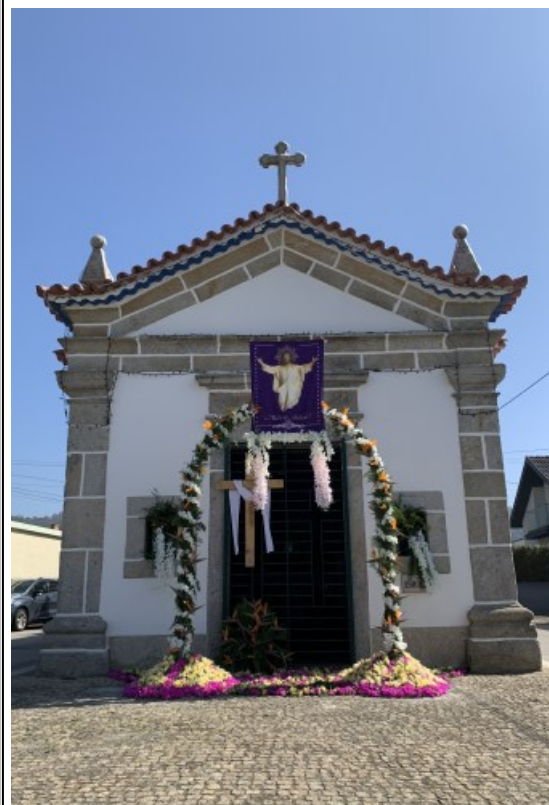
SÃO SEBASTIÃO Cepões