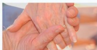
Cuidar dos Nossos Idosos O passado também nos toca