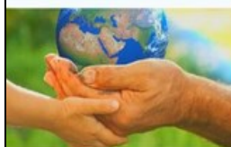
Cuidar da Casa Comum Um planeta que nos toca