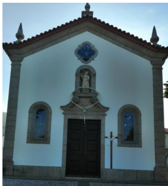
SÃO ROQUE Góios