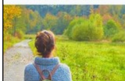
Cuidar dos Nossos Jovens Tocar na escolha das vocações