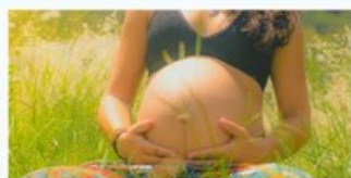
Cuidar da Vida que Nasce Tocar numa nova criatura