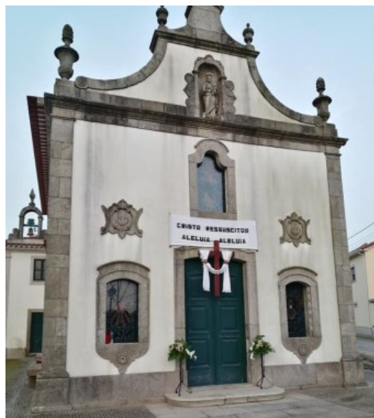
SENHORA DA SAÚDE Outeiro