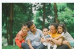
Cuidar da Família Os laços que se tocam