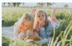
Cuidar e Educar os Filhos Tocar o futuro das gerações