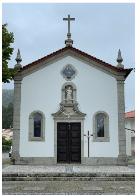
SÃO ROQUE Góios