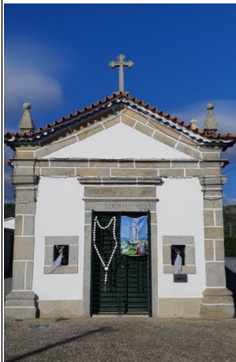
SÃO SEBASTIÃO Cepães