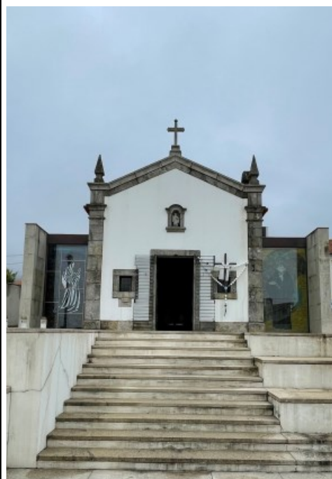
SÃO BENTO Pinhote