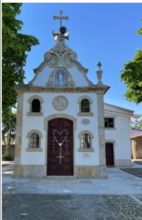
SÃO JOÃO Monte