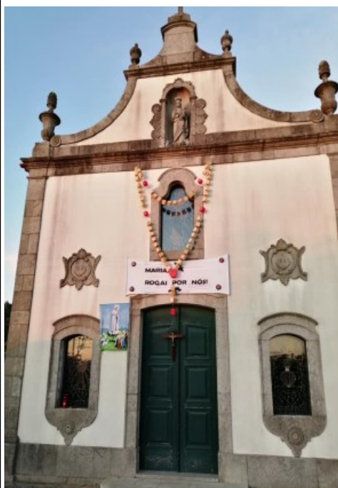
SENHORA DA SAÚDE Outeiro