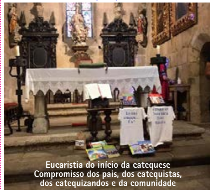
Eucaristia do início da catequese Compromisso dos pais, dos catequistas, dos catequizandos e da comunidade

No sábado, 9 de Outubro às 21.00 nas salas de catequese, haverá uma nova reunião de preparação para o Baptismo destinada a todas as famílias com crianças para baptizar nos próximos meses e para todos aqueles que pretendam assumir o múnus de padrinho/madrinha, em Barcelos ou noutras paróquias.