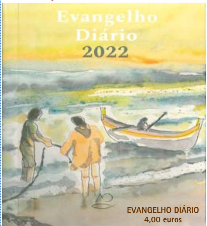
EVANGELHO DIÁRIO 4,00 euros

Vale a pena lê-la e meditá-la: https://www.vatican.va/content/francesco/pt/messages/missions/documents/papa-francesco_20210106_giornata-missionaria2021.html