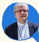
ABERTURA D. JOSÉ CORDEIRO

16 DE SETEMBRO // 9H30 Espaço Vita- R. São Domingos 94